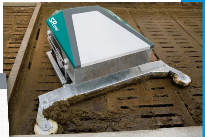
Wendig auf kleinstem Raum