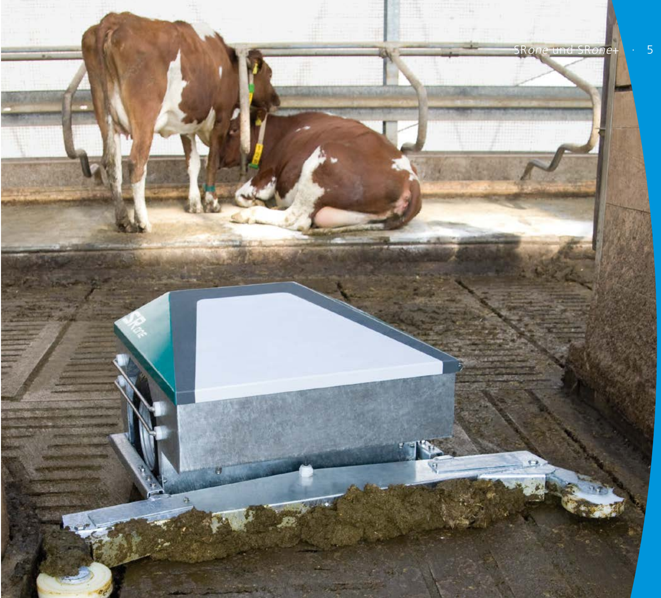
Über 500 kg Eigengewicht für satten Griff