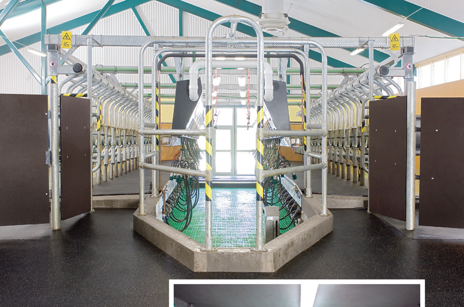
Ausführung: Global 90i ohne Subway