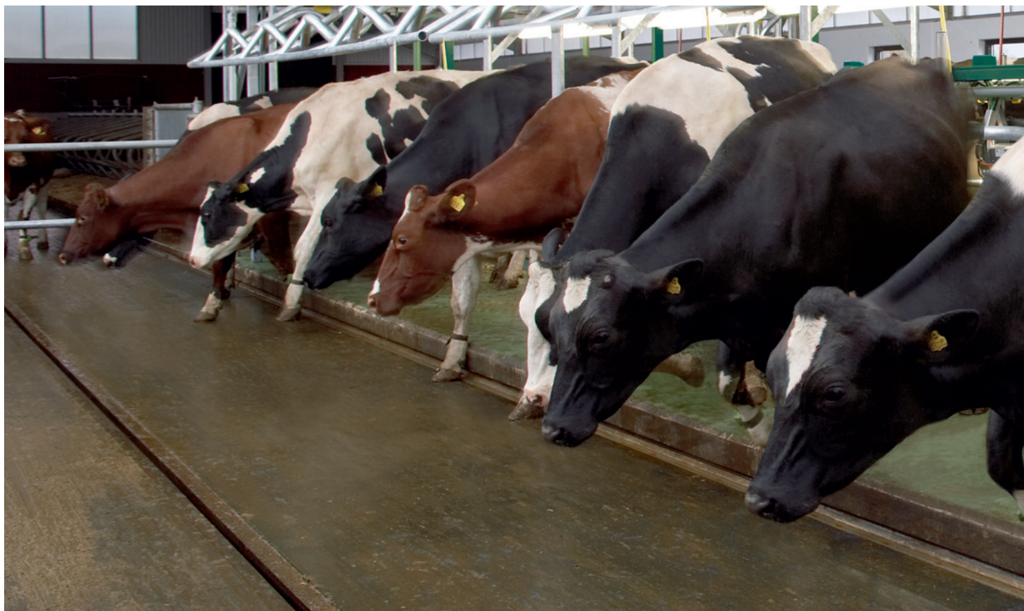
EuroClass 1200 RE

Das Frontgatter mit integriertem Indexbügel ermöglicht ein schnelles und perfektes Positionieren der Tiere. Der Effekt: Zeitgewinn durch schnelleres Ansetzen der Melkzeuge und verbessertes Milchabgabeverhalten dank entspannter Tiere. Ein weiteres Plus ist die flexible Höheneinstellung des Brustgatters. Es lässt sich an die Größe verschiedener Rassen anpassen.